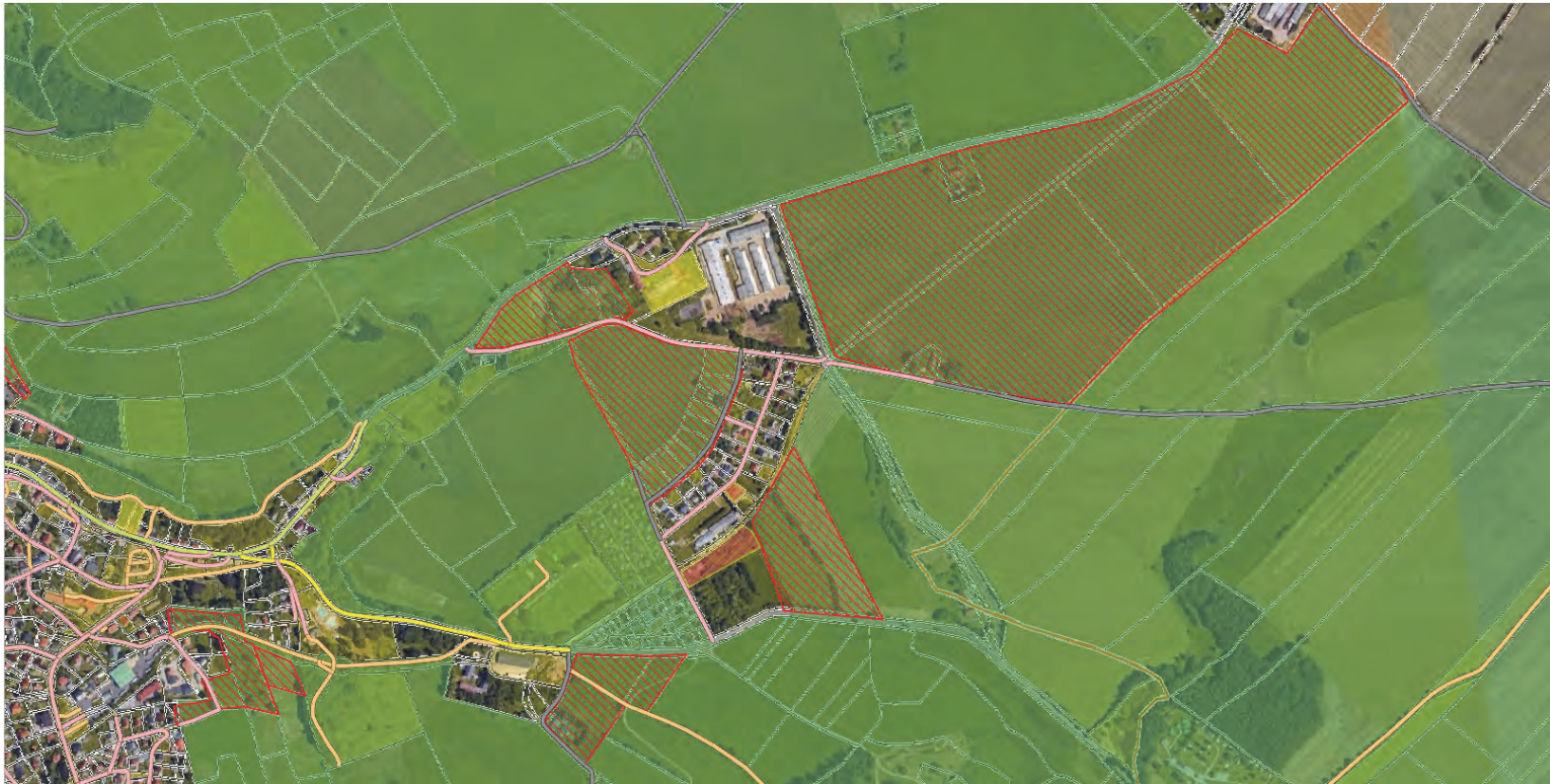
Flächenentwicklung nördlich von Hohnstein