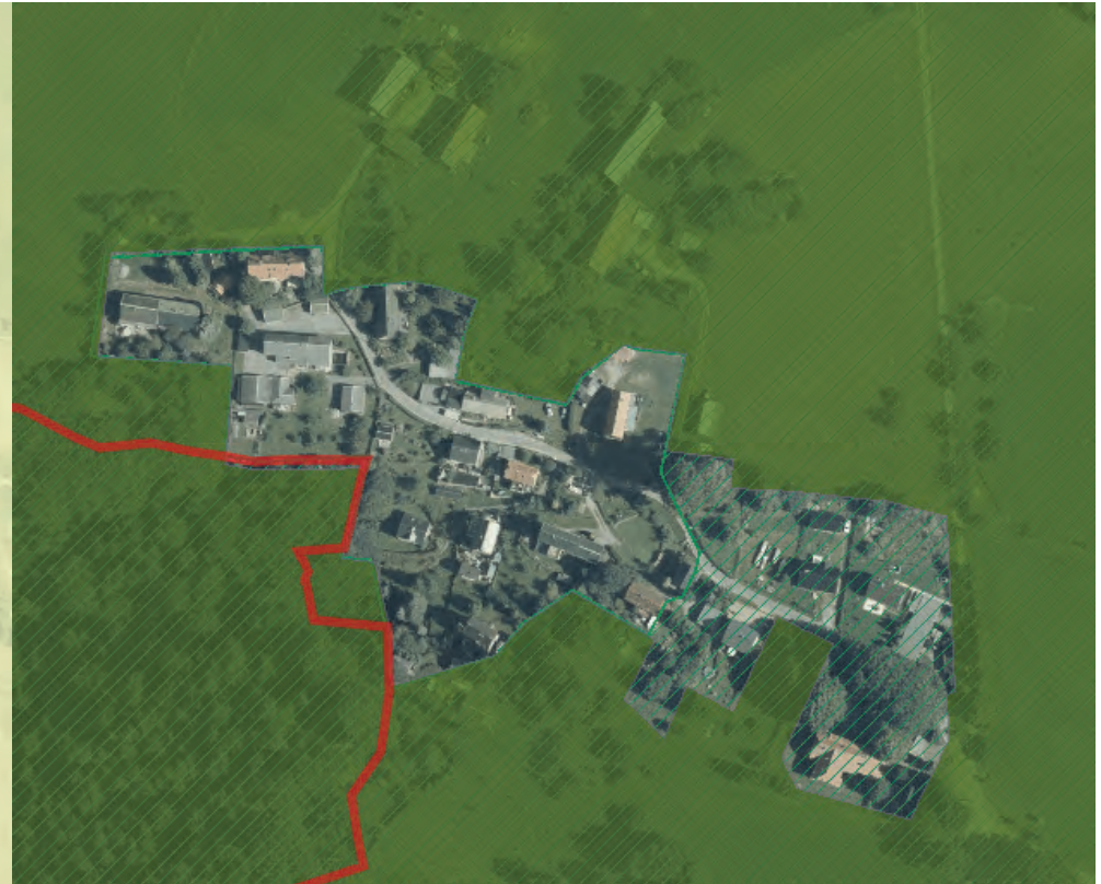
Nationalpark in Waitzdorf