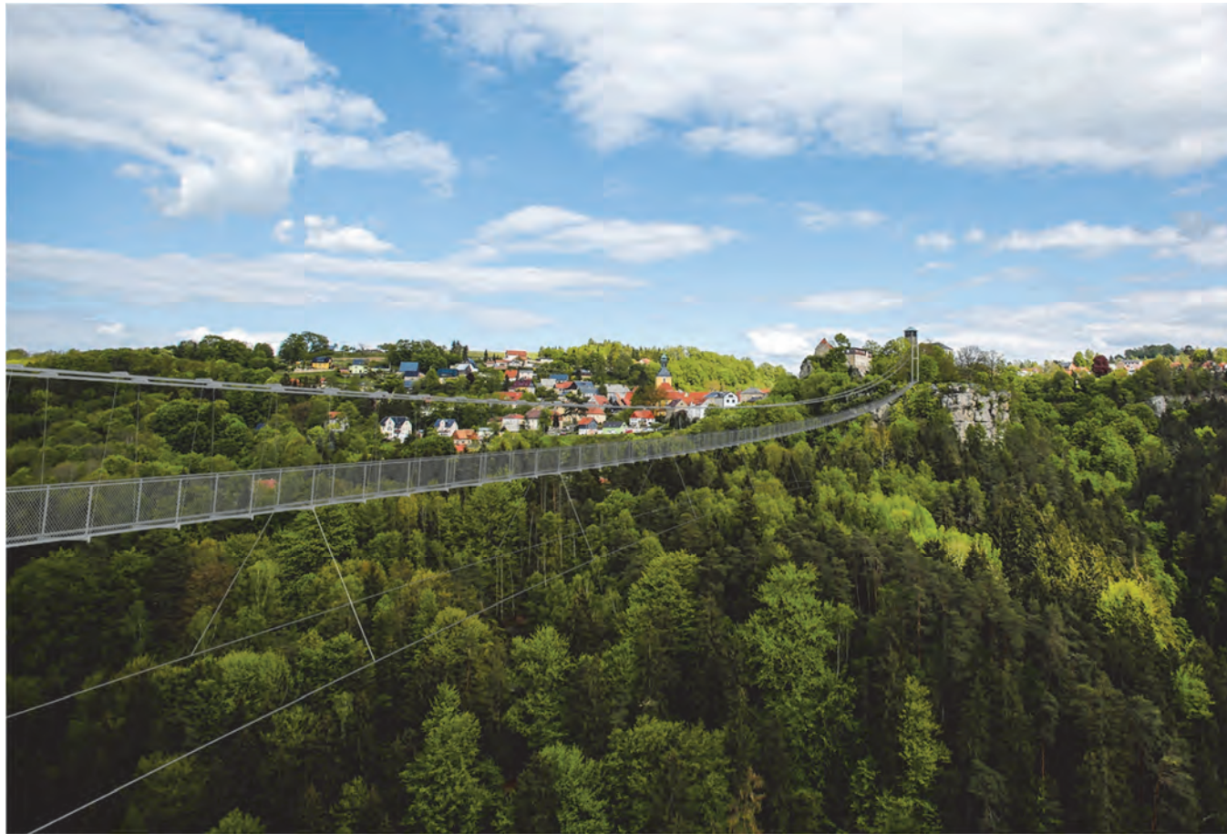
Bild: © Stadt Hohnstein Foto: Thomas Türpe Dresden, Visualisierung: Dieter Linka Oberstdorf