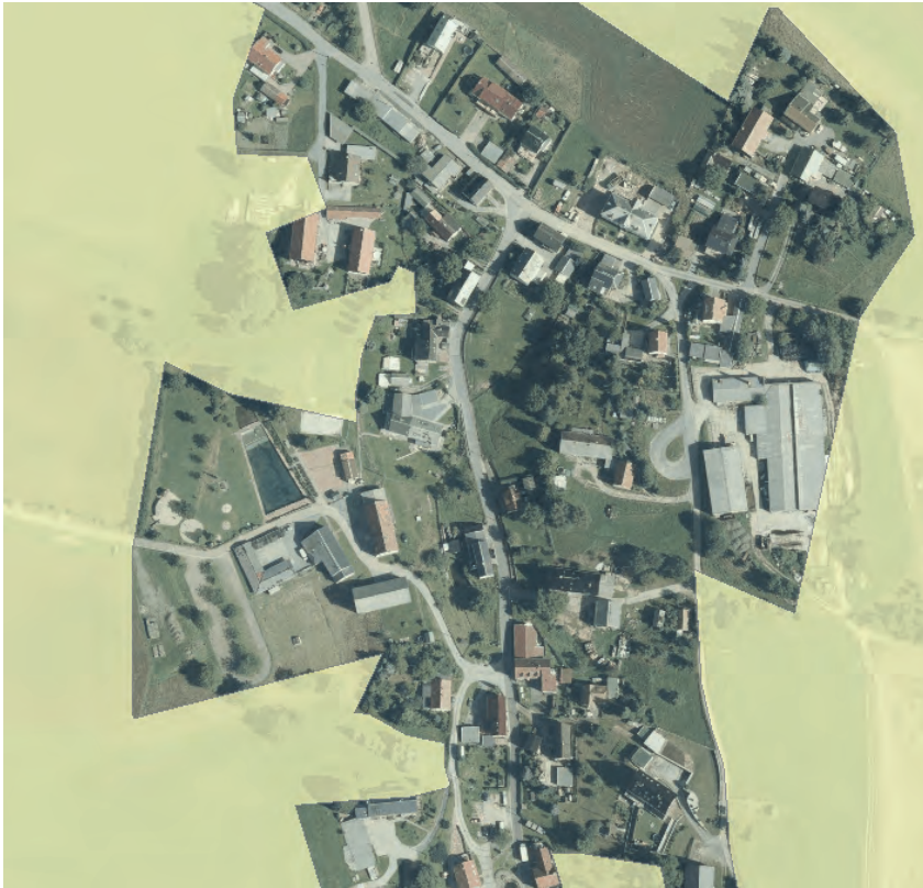
Landschaftsschutzgebiet in Goßdorf