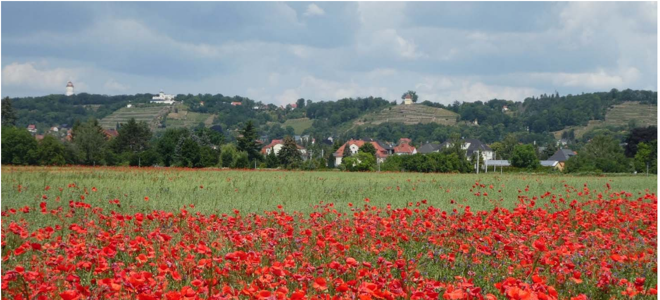
Elbhang in Radebeul

Sehr geehrte Damen und Herren, liebe regionale Akteure,